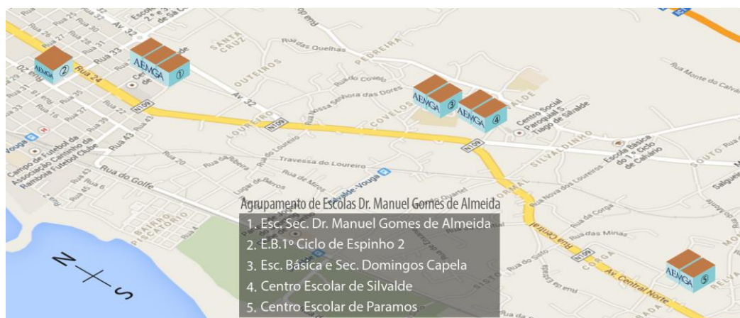
Figura n.º 2 Mapa das unidades orgânicas que integram atualmente o AEMGA

O AEMGA aglomera atualmente um total de cinco unidades orgânicas (UO) das freguesias de Espinho, Silvalde e Paramos (cf. Figura n.º 2).