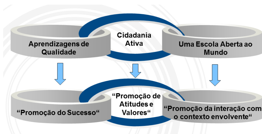
Figura n.º 1 Visão de Escola assente nos Resultados, nos Valores e na Comunidade

A Missão do AEMGA encontrar-se-á detalhada nos objetivos e nas estratégias complementares constantes do seu Projeto Educativo do Agrupamento, nos Planos de Melhoria a implementar anualmente, no Plano de Ação Estratégica (integrado no Programa Nacional de Promoção do Sucesso Escolar), no Plano Anual de Atividades ou mesmo no próprio Projeto de Intervenção apresentado pelo seu Diretor.