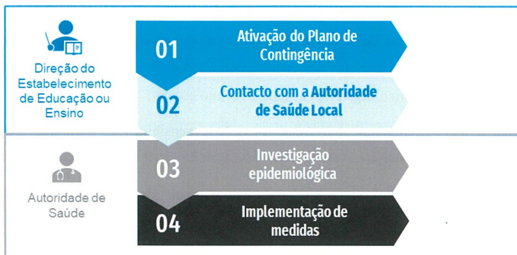
Fluxograma n.º 2