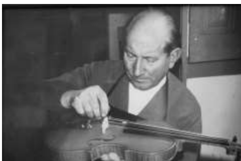
Figura n.º 2 Retrato de Domingos Ferreira Capela

Foi também um cidadão exemplar , defendendo os mais desfavorecidos a quem tratava graciosamente. Dotado de grande curiosidade científica , procurou sempre atingir a excelência , o que mereceu o seu reconhecimento público.