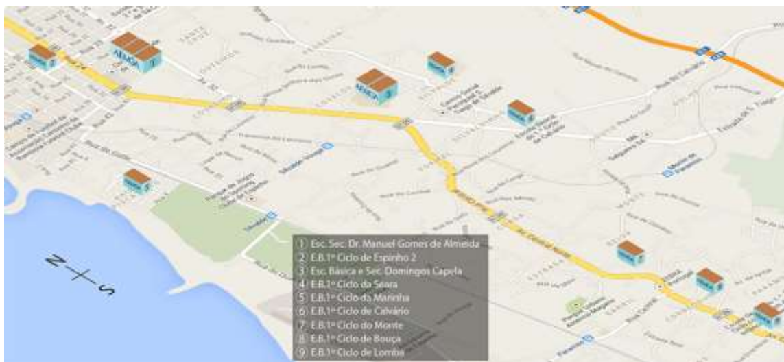
Imagem n.º 2 Mapa das unidades orgânicas que integram atualmente o AEMGA

O AEMGA nasce de um processo de reorganização da rede escolar ocorrido sobretudo no decorrer do ano letivo de 2011/2012, resultando da fusão da Escola Secundária Doutor Manuel Gomes de Almeida 3 , do Agrupamento de Escolas Domingos Capela 4 , em Silvalde, e da Escola n.º 2 de Espinho (que anteriormente integrava o Agrupamento de Escolas Sá Couto). O AEMGA foi, neste contexto, constituído formalmente por despacho do Secretário de Estado do Ensino e da Administração Escolar a 28 de junho de 2012, tendo a tomada de posse da sua Comissão Administrativa Provisória (CAP) ocorrido no dia 4 de julho de 2012.